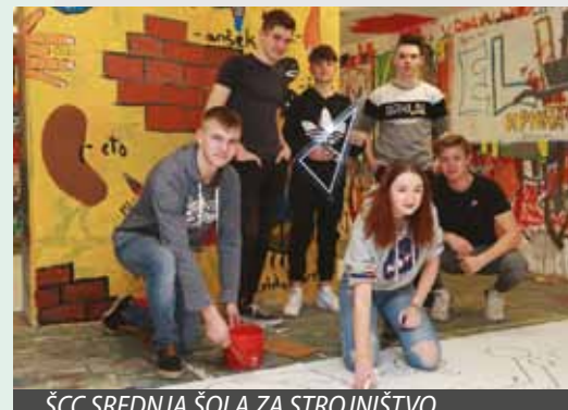
ŠCC SREDNJA ŠOLA ZA STROJNIŠTVO, MEHATRONIKO IN MEDIJE