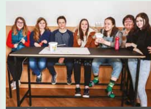
DIJAŠKI IN ŠTUDENSKI DOM CELJE