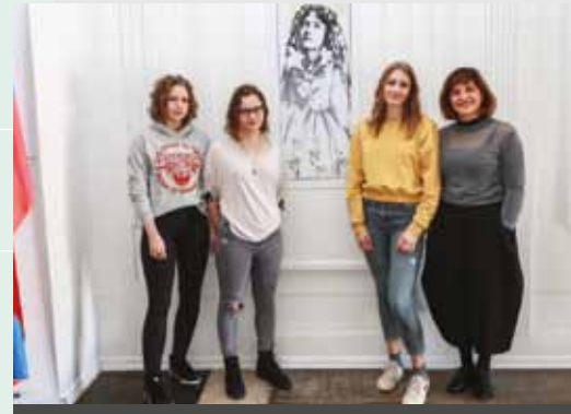
GIMNAZIJA CELJE - CENTER