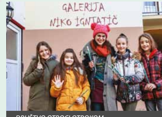
DRUŠTVO OTROCI OTROKOM