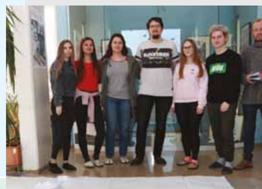
EKONOMSKA ŠOLA CELJE