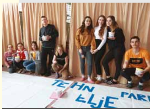
OSNOVNA ŠOLA GLAZIJA