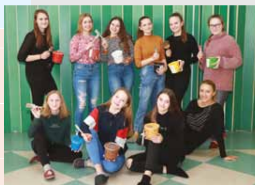
OSNOVNA ŠOLA LJUBEČNA