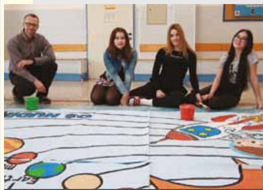
OSNOVNA ŠOLA HUDINJA