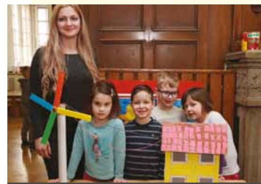
VRTEC TONČKE ČEČEVE, ENOTA GABERJE