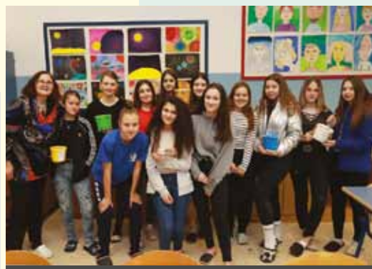
OSNOVNA ŠOLA FRANA ROŠA