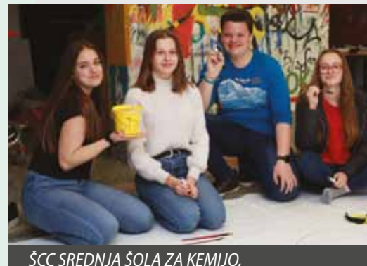
ŠCC SREDNJA ŠOLA ZA KEMIJO, ELEKTRONIKO IN RAČUNALNIŠTVO