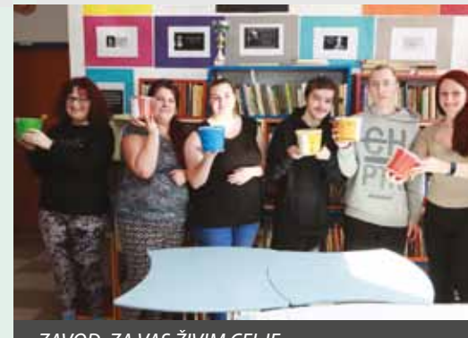
ZAVOD ZA VAS ŽIVIM CELJE