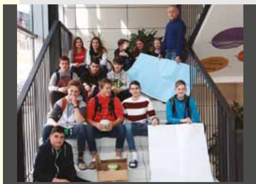
OSNOVNA ŠOLA FRANA KRANJCA