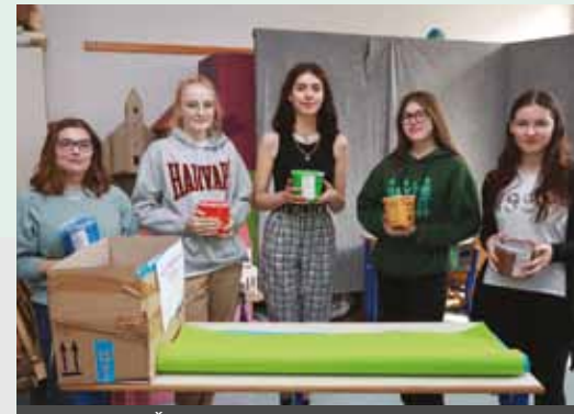
SREDNJA ŠOLA ZA GOSTINSTVO IN TURIZEM CELJE