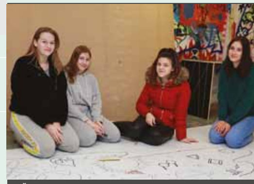
ŠCC GIMNAZIJA LAVA