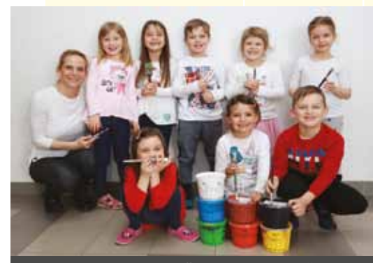
VRTEC DANIJELOV LEVČEK, ENOTA SLOMŠEK