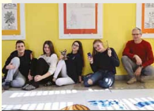
IV. OSNOVNA ŠOLA CELJE