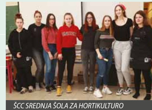
ŠCC SREDNJA ŠOLA ZA HORTIKULTURO IN VIZUALNE UMETNOSTI