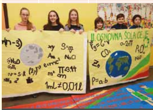
II. OSNOVNA ŠOLA CELJE