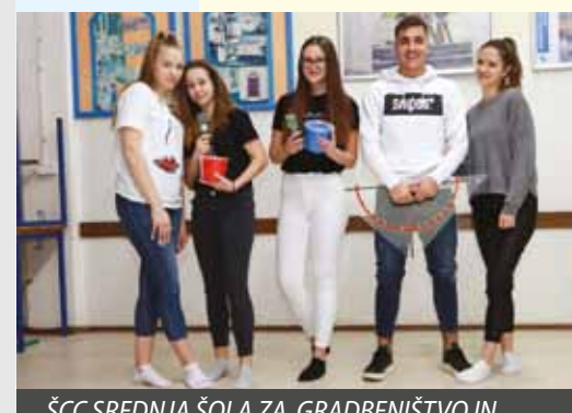
ŠCC SREDNJA ŠOLA ZA GRADBENIŠTVO IN VAROVANJE OKOLJA