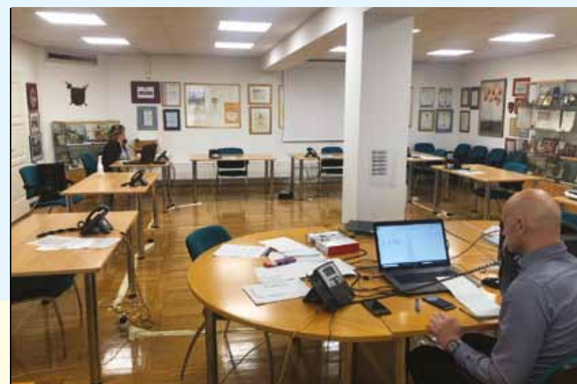
Klicni center MOC

Varstvo otrok v Mestni občini Celje poteka na domu staršev otroka. Starši, ki potrebujejo varstvo za svoje predšolske otroke, naj to sporočijo na elektronski naslov ravnateljice Vrtca Tončke Čečeve: ravnateljica.vtc@siol.com ali na telefonsko številko 041 612 473 . Starši osnovnošolskih otrok, ki potrebujejo varstvo, naj to sporočijo ravnatelju III. osnovne šole Celje: aleksander.verhovsek@3os-celje.si ali na številko 031 343 057 . Do tovrstnega varstva otrok so upravičeni starši predšolskih otrok in otrok od 1. do 5. razreda, ki opravljajo delo, ki je nujno za delovanje družbe in države v izrednih razmerah, če sta oba starša zaposlena v eni od takšnih organizacij in imata oba razporeditev dela v isti izmeni.