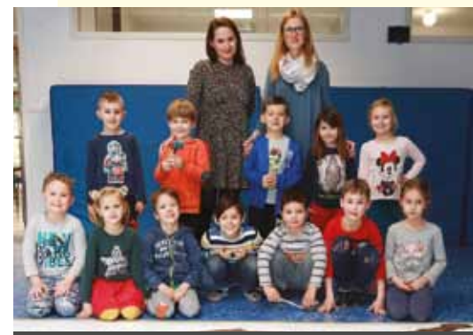
VRTEC ZARJA, ENOTA ČIRA ČARA