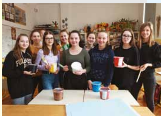
I. OSNOVNA ŠOLA CELJE