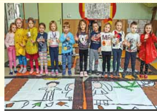
VRTEC ANICE ČERNEJEVE, ENOTA HRIBČEK