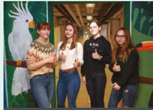
I. GIMNAZIJA V CELJU