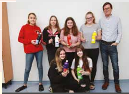
OSNOVNA ŠOLA LAVA