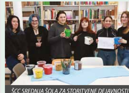
ŠCC SREDNJA ŠOLA ZA STORITVENE DEJAVNOSTI IN LOGISTIKO