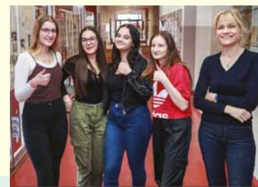
SREDNJA ZDRAVSTVENA ŠOLA CELJE