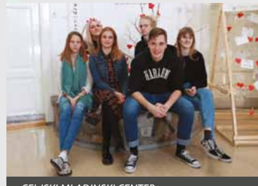
CELJSKI MLADINSKI CENTER