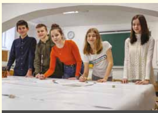
III. OSNOVNA ŠOLA CELJE